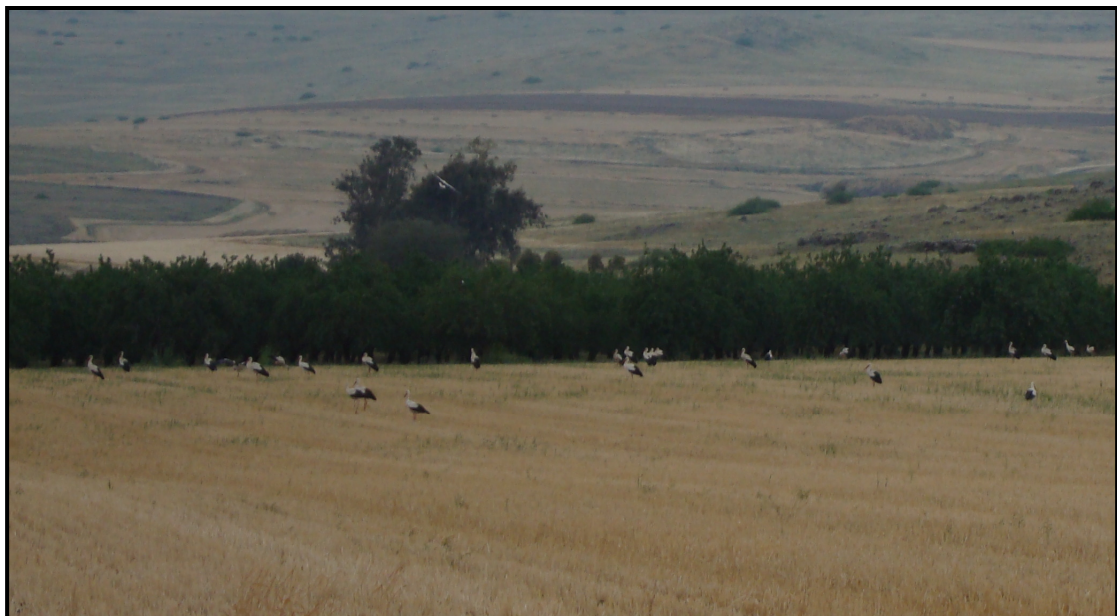
להקת חסידות נוחתות בשדה בבקעת יבנאל לקראת לינה

שהן פשוט ההסבר המושלם. האגדה המדוברת נהגתה לראשונה בתרבויות צפון אירופה, באזורים שבהן נוהגות החסידות לקנן מדי שנה. ביום הארוך ביותר בשנה, ה-21/6, היה מקובל לקיים הילולות וחגיגות הכוללות בדרך כלל גם חתונות. מכאן ניתן להסיק שמי שמתחתן ביוני ככל הנראה יביא לעולם ילדים כתשעה חודשים לאחר מכן, באזור מרץ – אפריל. אלו גם החודשים שבהם החסידות חוזרות לאירופה לאחר החורף, בלהקות אדירות הנראות לעין בכל מקום. בנוסף להגעת החסידות בחודשים המדוברים, מדובר בעוף עדין ואצילי ועם זאת מספיק גדול בשביל הצליח לסחוב תינוק וגם לשמור עליו. נדידת החסידות מהצפון לדרום ובחזרה נמשכת כתשעה חודשים ממש כמו הריון של תינוק, וכן בני הזוג חיים ביחד במשך כל חייהם ותמיד חוזרים לאותו הקן ומפתחים אותו. אפשר לומר שהחסידה היא ממש התגלמות האידיאל ההורי, ואם נאמר את האמת, לאדם יש מה ללמוד ממנה. צאו החוצה, תרימו את הראש ותפרשו ידיים - ואולי תצליחו לתפוס תינוק או שניים. אם לא, אז לפחות הרוחתם מראה מרהיב לעיניים. יומולדת שמח!