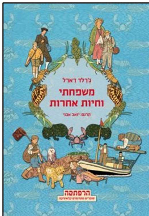
עזר במימון מסעות המחקר. ספרו "משפחתי וחיות אחרות"

נ.ב. הכתבה מוקדשת למדריך הבוגר שלנו לשעבר, אחיעד סוירי, שגם בשבילו עולם החי זה לא רק תחביב, אלא דרך חיים.