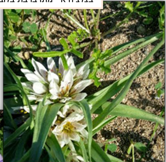
בצלציה א"י מתרברבת בלובן בוהק