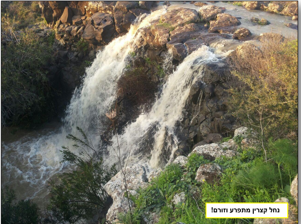
נחל קצרין מתפרע וזורם!

תגידו מה אתכם? כבר יצאתם לטייל בחורף? זה בדיוק הזמן לבוא לחוות את השטח הגולני, בואו אלינו! אם גם אתם ראיתם וצילמתם בעל חיים מיוחד באזורינו- צרו עמנו קשר באחד המיילים המוצגים למטה