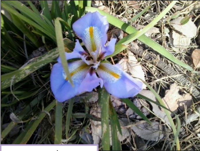
אירוס הלבנון בשיא הדרו