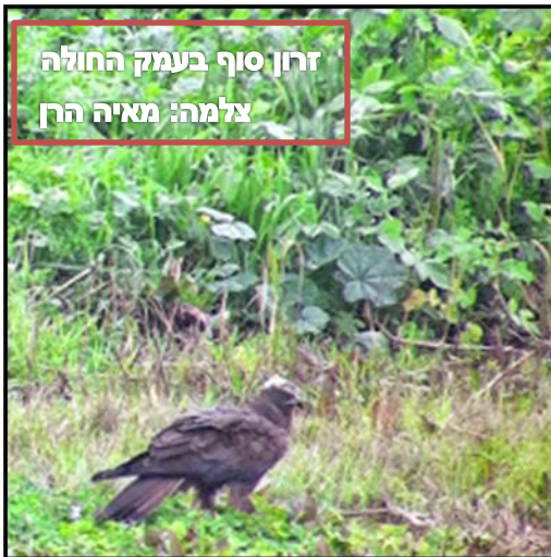
זרון סוף בעמק החולה

הנה חלק מתצפיות החודש ותמונות שיטריפו לכם את החושים ויגרמו לכם לבוא ולטייל במקום הכי יפה בעולם.