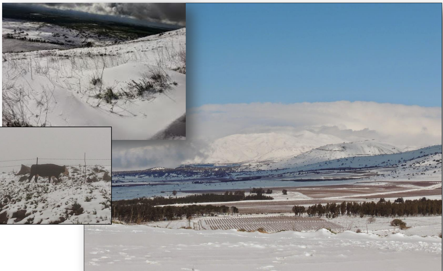
החרמון וצפון הרמה מושלגים (תצפיות מהר שיפון)