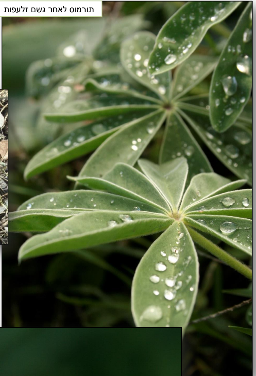
תורמוס לאחר גשם זלעפות