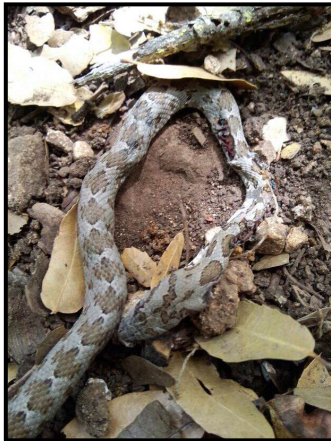
זעמן מטבעות מת

אנחנו מקווים שהצלחנו להביא למודעות שלכם את השפעותיכם, בהיותכם בני אדם, על הטבע. שימו לב לצעדיכם, ועזרו לנו לשמור על הטבע של כולנו.