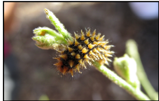
זחל של נימפית הבוצין

הקיץ הגיע ואיתו הקיפודים! קיפוד באלון תבור