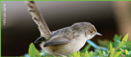
פשוט Graceful Prinia פסיסי