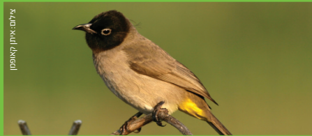
בולבול Bulbul בלבל