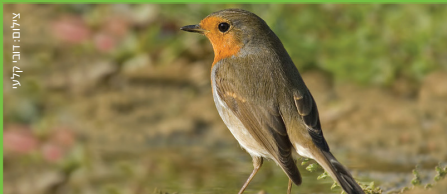
אדום החזה Robin אבו الحنا