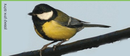
ירגזי מצוי Great Tit קרנף קטן