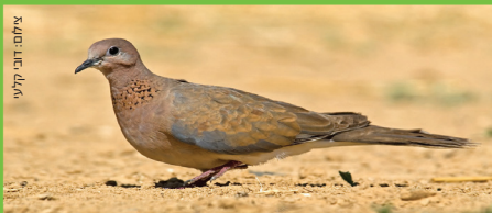
צוצלת Laughing Dove דסיסה / רעטלה