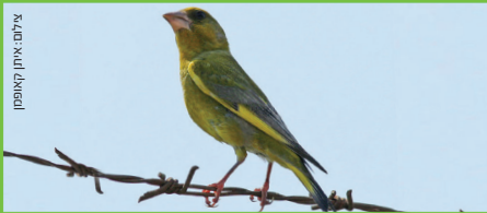
ירקון Greenfinch חסון אצטר