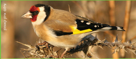
חוחית Goldfinch חסון