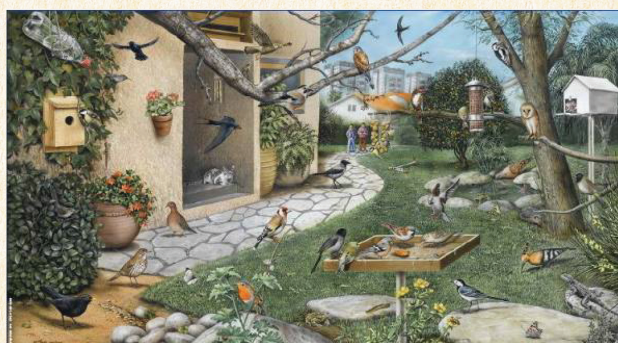
צויר של טוביה קורץ מתוך ערכת בשביל הטבע בעיר ציפורים בסביבה הקרובה http://www.yardbirds.org.il/inner/34

http://www.yardbirdsil.info/birds_cd_new/besvil.pps (שנותנת מידע לגבי כל אחד מהיצורים שבה), ונבקש מהמשתתפים לספור כמה מינים שונים של צמחים ובעלי חיים הם רואים בה, וכמה מתוכם הם ציפורים. נבקש מהם לחפש בכרזה דוגמאות של התערבות האדם לטובת הציפורים: תיבת קינון לתנשמות, תיבת קינון לירגזי ותיבת קינון לבז, מתקן האכלה תלוי לזרעים ושולחן האכלה של פירות, בקבוק שתייה, בריכת מים.