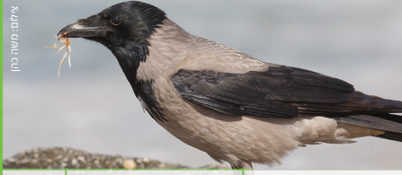
עורב אפור Hooded Crow גראב רמאדי