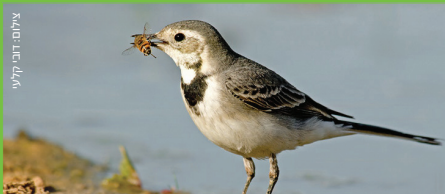
נחילאי לבן Pied Wagtail כרסאי