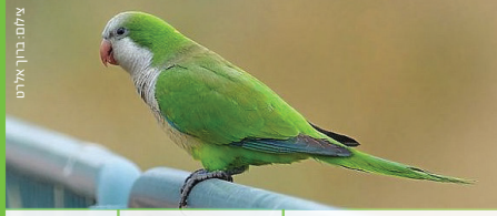
תוכי מזיר Monk Parakeet ביגא ראהב