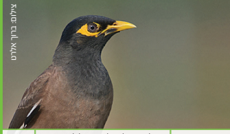
מיינה מינה Common Myna