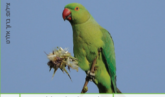
דררה דרה Rose-ringed Parakeet