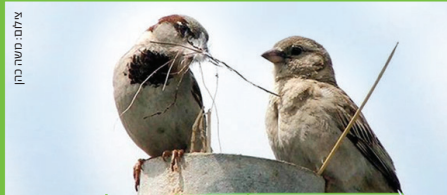
דרור הבית House Sparrow דורי הבית