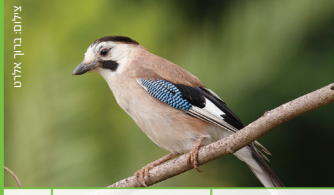
עורבני שחור כפה Jay איו זריק