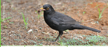
שחור Blackbird שחור