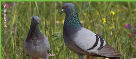
יונה Feral Pigeon חמא טוראני