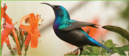
צופית בוקהת Palestine Sunbird אבו הזר