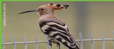
דוכיפת Hoopoe הדאה