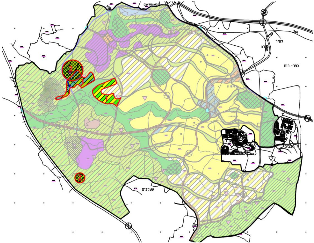
איור 1- שטחים מיועדים לתיירות על פי מד/2020