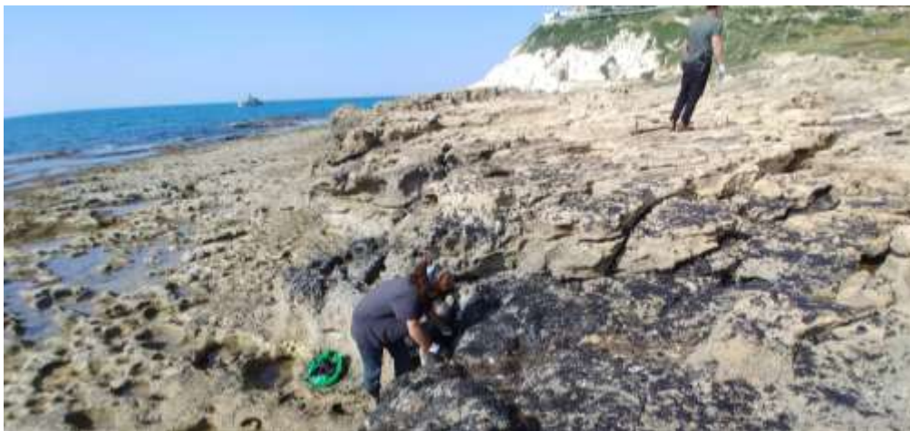
מתנדבים מנקים זפת בחוף ראש הנקרה.