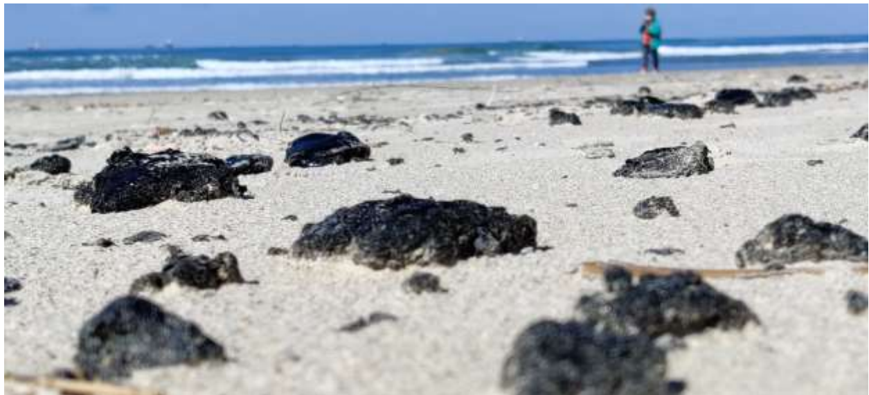
זיהום זפת, פברואר 2021.

זפת היא חומר צמיגי מאוד (נוזל סמיך, הנראה כמוצק) בצבע כהה, שחור או חום, תוצר של נפט גולמי שנשפך למי הים. כאשר הנפט הגולמי צף על פני המים, הוא מצטמצם בנפחו ונעשה צמיג, והחומרים הנדיפים מתאדים לאטמוספירה. הרוח והגלים מפצלים את גושי הנפט לכדורים של זפת שנישאים בזרמי הים עד אשר הזרמים והגלים פולטים אותם לקו החוף שם הם מצטברים על החול והסלעים. בעבר, בשנות השבעים והשמונים, מצבורי זפת בחוף הייתה תופעה מוכרת וכל ביקור בחוף הים היה נגמר בפעילות להסרת כתמי הזפת מכפות הרגליים. מקור הזיהום בשנים אלו היה נפט שמקורו בחצי האי ערב והמפרץ הפרסי. מיכליות נפט עברו מאיראן דרך תעלת סואץ לנמלי ישראל. הנפט דלף מאוניות ושהה מספר שבועות בים עד שהגיע לחוף. היעלמות הזפת מהחופים מוסברת ע"י מספר גורמים: א. אמנות בינלאומיות שהטילו קנסות על מזהמים וחייבו התקנת ציוד למניעת זליגת נפט וכן תקנות מקומיות למניעת זיהום ים, שהסדירו את הכללים לטיפול ושינוע של שמן ונפט. ב. עליית מחיר הנפט גרמה לאינטרס כלכלי למניעת דליפות נפט. ג. סגירת תעלת סואץ לספינות מטען וההפיכה באיראן ב-1978 שלאחריה הפסיקו להגיע מיכליות נפט מזהמות. המשרד להגנת הסביבה אמון על בדיקת זיהום נפט בנמלים ובקרב ספינות. מרבית הזיהומים כיום מתרחשים עקב תקלות טכניות, בנמלים או בלב הים.