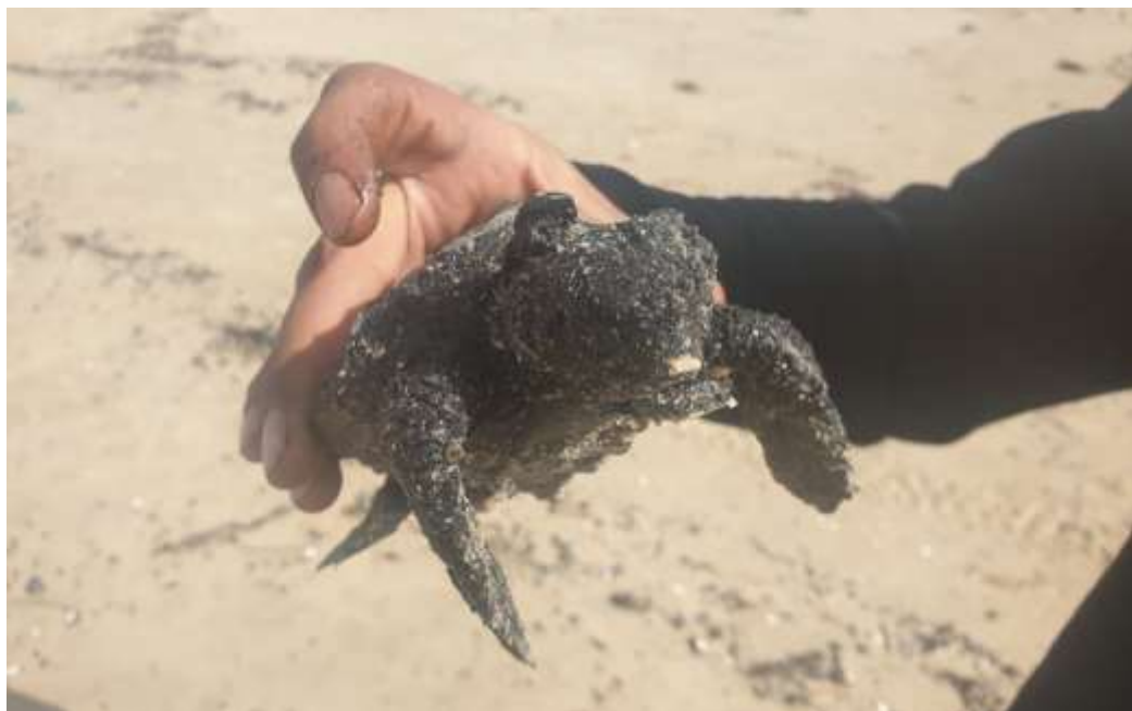
צב ים מכוסה זפת.

זפת מתפרקת באופן טבעי בקצב איטי מאוד. הזפת שנשארת לאורך זמן על החוף מסוכנת גם בשל שחרור של חומרים רעילים לסביבה, שממשיכים להיפלט מגושי הזפת במשך שנים. הפתרון היעיל ביותר הוא איסוף ופינוי ידני של זפת מהחופים, בין השאר משום שהשיטה הזו גורמת לנזק הסביבתי הקטן ביותר.