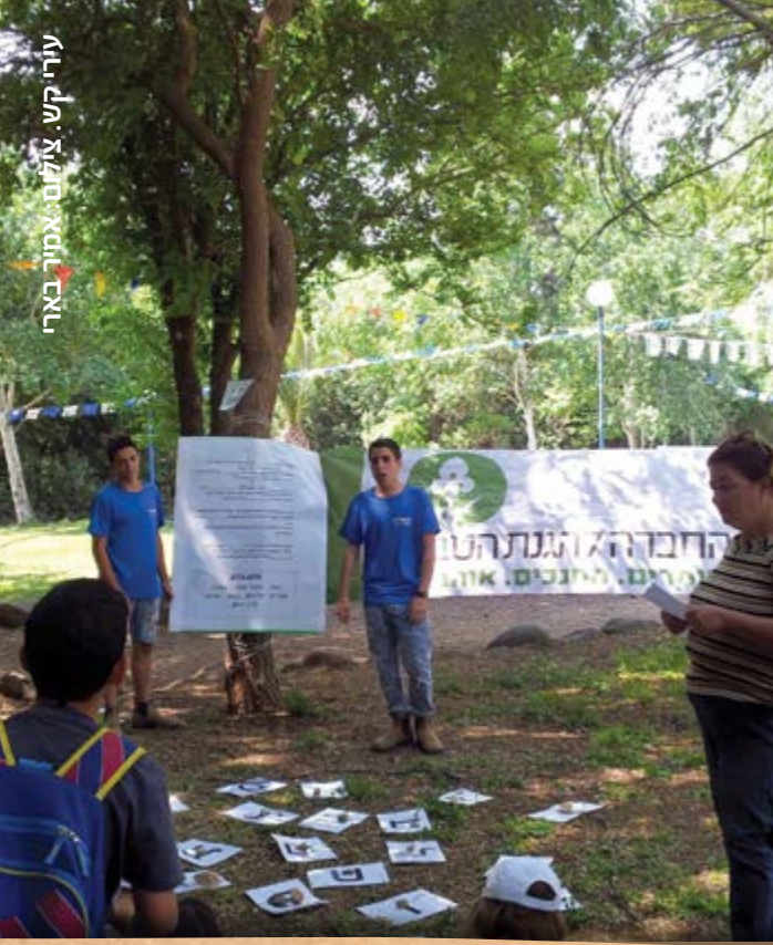
עורר קש.