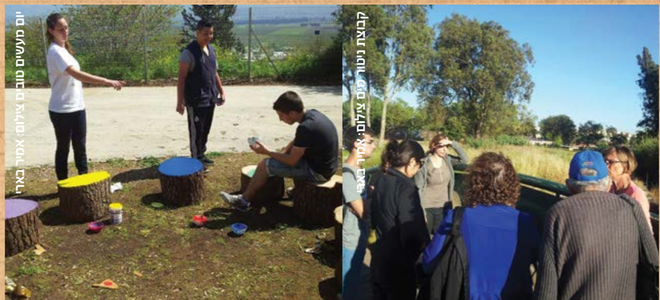
יום מעשים טובים