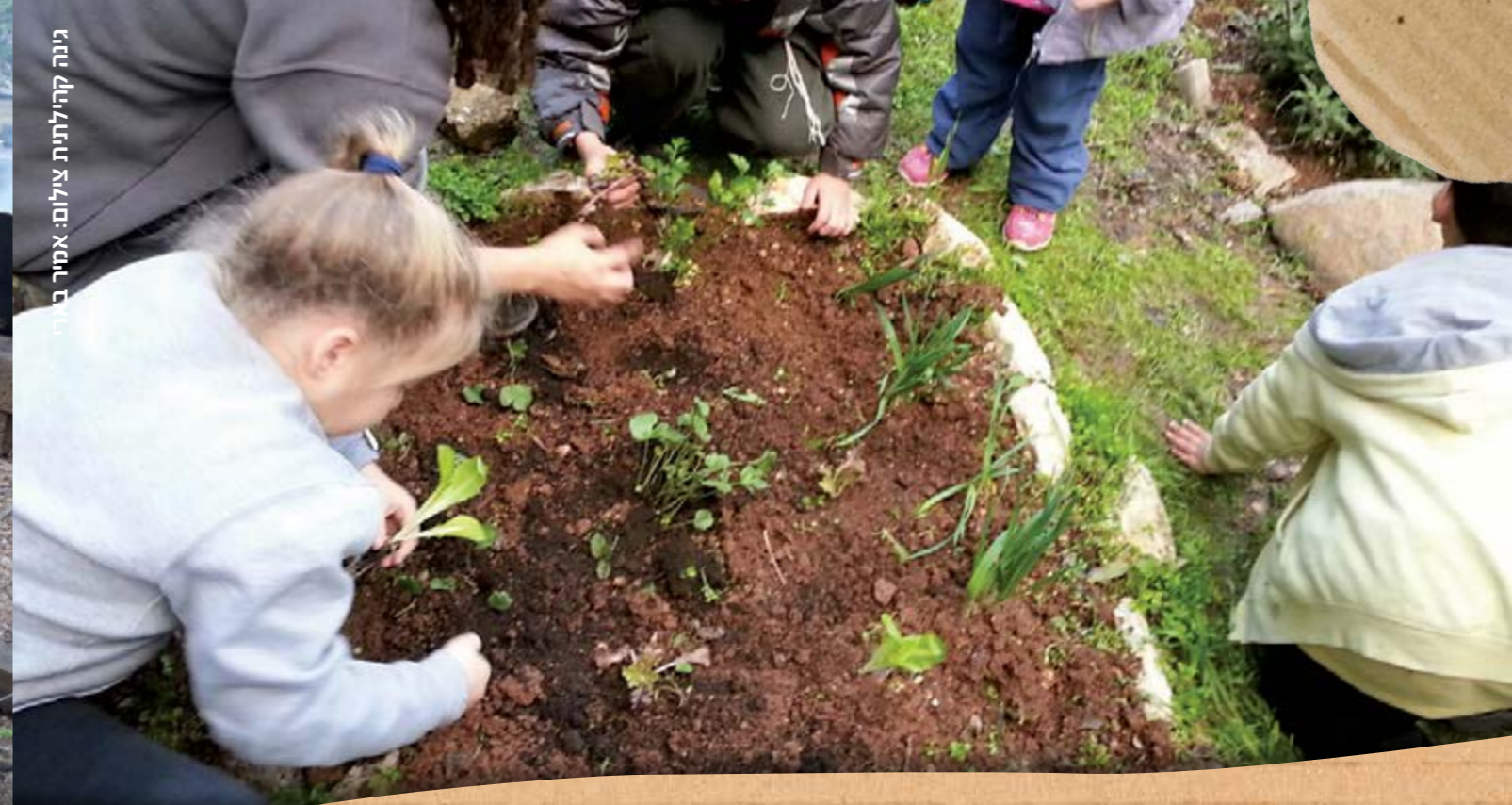
גינה קהילתית