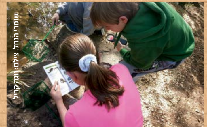
שומרי הנחל.

כמו בכל שנה שותפה החברה להגנת הטבע בפרויקט "עירי קריית שמונה" לתלמידי כיתה ד' בכל הישוב בהובלת אגף החינוך. השנה פעלנו תחת הכותרת "בשביל העיר". הילדים למדו על אתרי טבע, מורשת והיסטוריה בעיר, הכינו דפי מידע לכל אתר ודגם של אתר נבחר בעיר. האירוע הגדול התקיים בפארק הזהב, המהווה בעצמו אתר טבע עירוני בעיר, עליו למדו הילדים. ביום השיא נחשף בפארק שביל בצבע ירוק, לכל אורכו, עליו הוצגו לראווה הדגמים היצירתיים של כל כיתה וכיתה שהשתתפה בפרויקט. בין הדגמים היו גבעת שחומית, בית החאן, פארק הזהב ועוד. האירוע הינו שיתוף פעולה מוצלח בין מרכז ללימודי שדה של החברה להגנת הטבע, מרכז פסג"ה, מדריכי שלח הצעירים (משצ"ם) מתיכון דנציגר ואגף החינוך של העיר. באירוע השתתפו כל תלמידי כיתות ד' של העיר, בשלל פעילויות מעשירות ומהנות. בין היתר כללו הפעילויות חידות על קריית שמונה- עבר והווה, שאלות חקר ובלשות על נחל עין זהב והצמחייה הרבה שבו, משימות של תנועה וספורט המאפיינים את העיר, המחזה בקבוצות וכן, צפייה בהצגה של צוות החברה להגנת הטבע אשר המחשה לילדים בדרך מרתקת את תחילת דרכה של קריית שמונה, מנקודת מבטם של העולים הראשונים: המגורים בפחון, התלות בנחל והתנאים השונים מהמוכר לנו היום. האירוע, שתוכן בקפידה זה חודשים על ידי כל הנוגעים בדבר, נחל הצלחה רבה והיווה שיא לתהליך החינוכי לילדי כיתות ד' להכרת העיר.