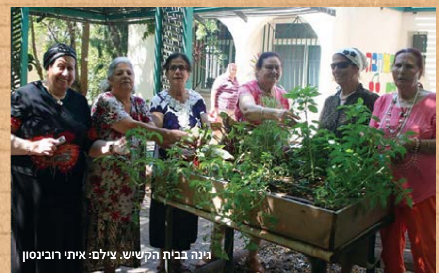
גינה בבית הקשיש.

החברה להגנת הטבע מפעילה בעיר גינות קהילתיות שפועלות בשיתוף עם תושבי השכונה, ילדים ומבוגרים כאחד. מלבד עבודת הגינה הקבועות כמו שתילה, השקיה, הנבטה, עישוב וניקיון, מתקיימות בגינה גם פעילויות שונות בנושאי טבע וקיימות. הגינות הקהילתיות הינן חלק ממארג המרחבים הירוקים בעיר ותורמות לשיפור איכות החיים העירונית. בקריית שמונה הקמנו כ-3 גינות קהילתיות: הגינה הקהילתית בשכונת אשכול, גינה קהילתית בבית הקשיש וגינה נוספת בבית ספר יצחק הנשיא בשיתוף "ביג" והמרכז האקדמי לנוער במכללת תל חי, גוינט ישראל ואשלים גוינט. הפעילים בגינות למדו על הצמחים הגדלים בגינה, על בעלי החיים שניתן לפגוש בה, וכמו כן עסקו בנושאים של מחזור ופסולת. יחד הכנו סלט מהירקות שגדלו בגינה, הכנו מתקנים להאכלת ציפורים, יצירה מחומרים ממחזרים, בישולי שדה ותה מצמחי הגינה, ועוד המון פעילויות חווייתיות.