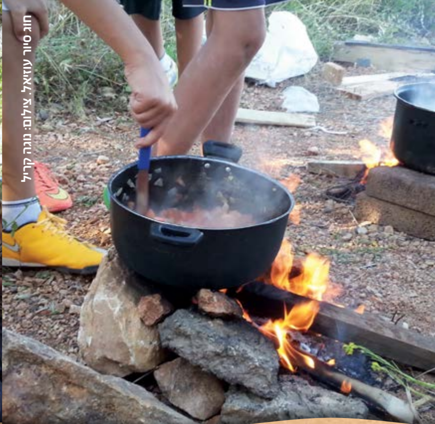
חוג סיוור עוזיאל.