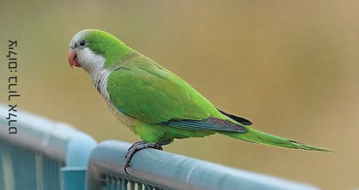
Monk Parakeet תוכי נזירי ביגא האהב