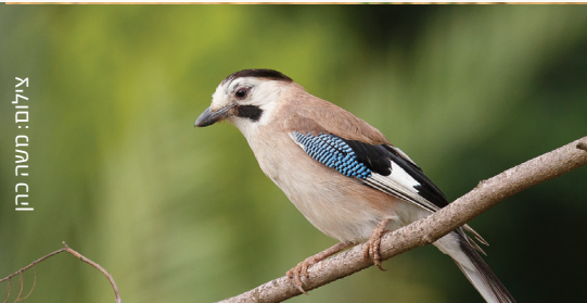
Jay עורבני שחור כיפה אבו זריק