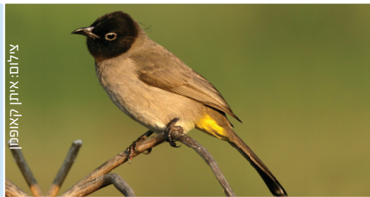
Bulbul בולבול בלבל