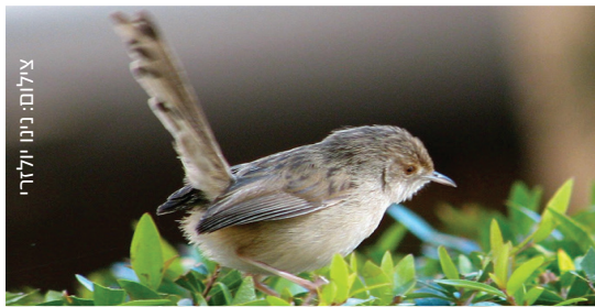
Graceful Prinia פשוט פסיסי