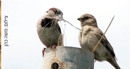
House Sparrow דרור הבית דורי הבית