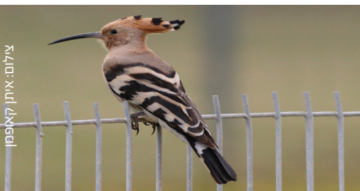
Hoopoe דוכיפת הדהד