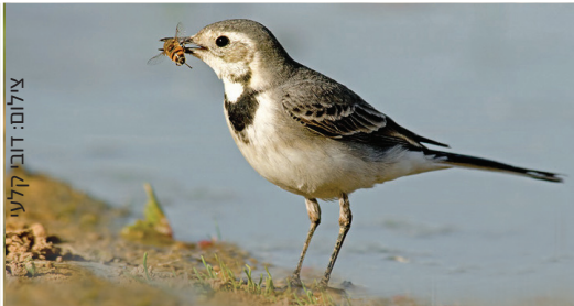
Pied Wagtail נחליאלי לבן כרס