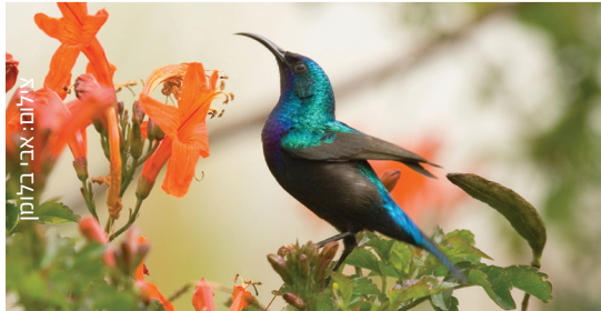
Palestine Sunbird צופית בוהקת אבו הזר