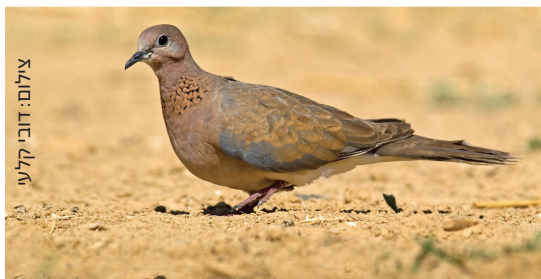
Laughing Dove צוצלת דבסיה זאחקה