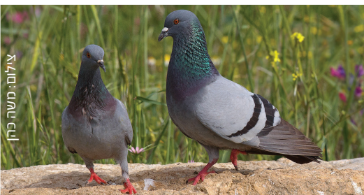
Feral Pigeon יונה חמא טוראני