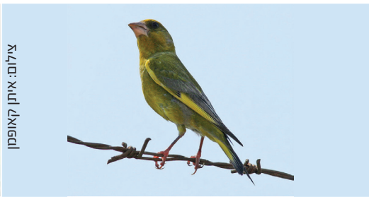
Greenfinch ירקון חסון אצטר