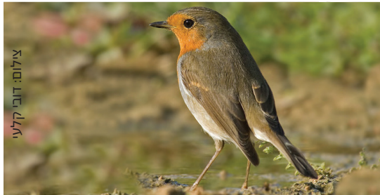
Robin אדום החזה אבו החנא