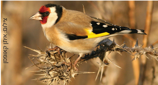
Goldfinch חוחית חסון