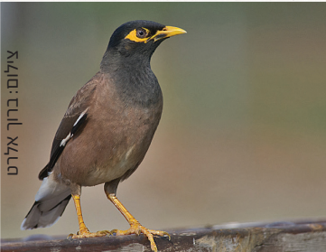
Common Myna מינה