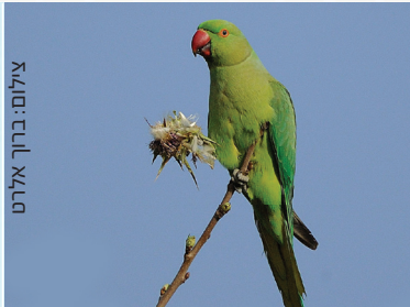
Rose-ringed Parakeet דררה דרה