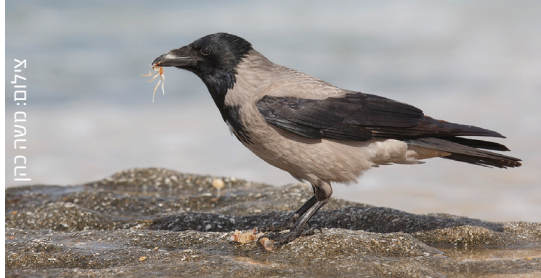
Hooded Crow עורב אפור גראב רמאדי