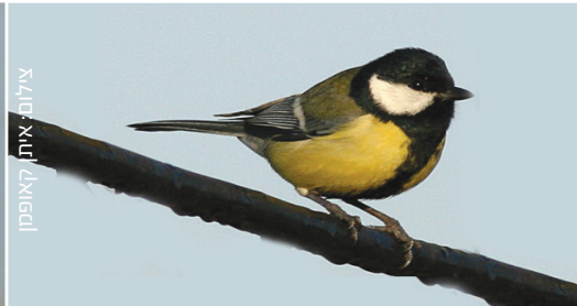
Great Tit ירגזי מצוי קרפף כביר