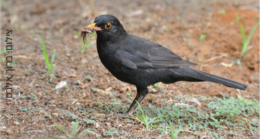
Blackbird שחרור שחרור