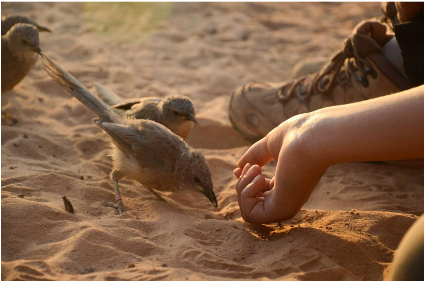
זנבנים שהורגלו לצורך מחקר בשמורת שיזף

זוהי ציפור מרתקת, מהסתכלות על אורחות חייה החברתיים, ניתן ללמוד הרבה עלינו, בני האדם, ואפילו להעלות שאלות מוסר- איך אני תורם לחברה?, האם אני סומך על חברי? האם אני מוכן לוותר על טובתי האישית למען רווחת הכלל? נגענו כאן רק בקצה הקרחון בכל מה שנוגע בזנבנים. מי שמתעניין ורוצה לדעת עוד מוזמן לקרוא את הספר "טווסים, אלטרואיזם ועקרון ההכבדה" שנכתב ע"י אמוץ ואבישג זהבי. ומי שרוצה לחוות את הזנבנים בעצמו מוזמן לביס"ש חצבה: שם עורכים סיורים לצפייה על זנבנים, מחקרים ועוד. הזנבנים מורגלים מאוד לנוכחות בני אדם ולכן אפשר ממש להאכיל אותם ולגעת בהם, בזהירות כמובן. מומלץ מאוד! מניסיון!