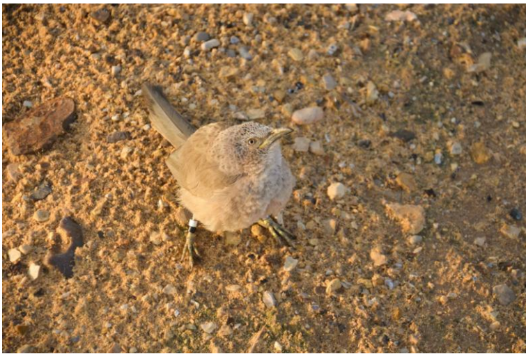
זנבן בשמורת שיזף ליד חצבה

עליה. זה מתבטא בעוד הרבה מחוות פשוטות כמו הליכה מחובקים, נשיקה או אפילו סתם חיבוק. כל אלה סימנים המכניסים אותך למצב חלש יותר, פחות מוגן, למצב שכביכול מכביד עליך, ועל יכולת התפקוד השגרתי שלך. דוגמה נוספת אצל בני אדם היא קניית מוצרים יקרים כגון פרארי או רולקס כדי לסמן את סמל הסטטוס שלך ולהראות לכולם כמה כסף ברשותך ולא דווקא חוזק פיזי כי בעולם המערבי כיום- כסף מסל כוח.