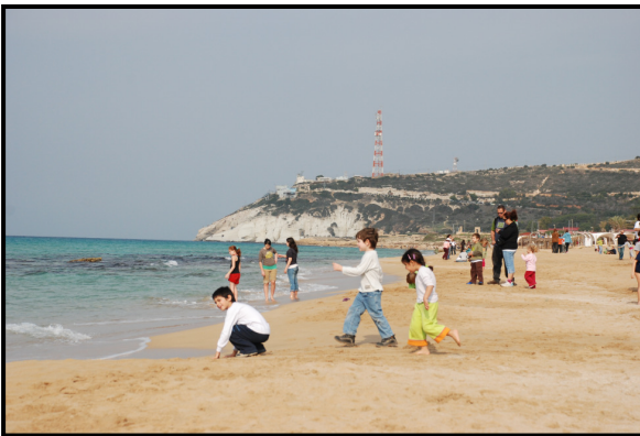
הפנינג שמירת טבע בחוף בצת

הסביבה הימית בגליל המערבי מגוונת ורגישה גם היא. ברצועת הים הקרובה לחוף מגוון גדול של תבליט ותצורות נוף תת- ימיות המשתרעות עד ששה ק"מ מקו החוף. מגוון מורפולוגי זה מהווה תשתית למגוון גדול של בתי גידול תת- ימיים עשירים. טבלאות הגידוד בחוף הצפוני של עכו ואלו הנאות והמפורצות מחוף אכזיב וצפונה בואכה ראש הנקרה אשר מהוות בית גידול קיצוני, ייחודי ועשיר מאין כמוהו, רכסי כורכר בתת- המים וביניהם קניונים תת- ימיים בהם עושר בתי גידול ומינים, איים קטנים, רכסי כורכר חופיים הנושאים צמחיית חוף מיוחדת ועשירה. כל אלה הוו בסיס איתן לייעודן של שלוש שמורות טבע ימיות מהן שתיים נרחבות יחסית; "חוף ראש- הנקרה", "חוף אכזיב" ו"שמורת- ים חוף בוסתן- הגליל" הקטנה.