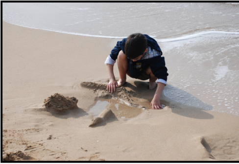
האם ישאר לנו חוף לבלות בו?

בנוסף חוף זה הוא בעל ערכים נופיים ייחודיים. מיקומו המיוחד של החוף וריחוקו היחסי מן הגוש העירוני הבנוי עושים אותו לחוף שקט ואינטימי שאין רבים כמוהו. בשל ייחודו זה, מהווה החוף מרחב בילוי, ספורט עממי ומפגש של תושבי הגליל המערבי על אוכלוסיותיו המגוונות.