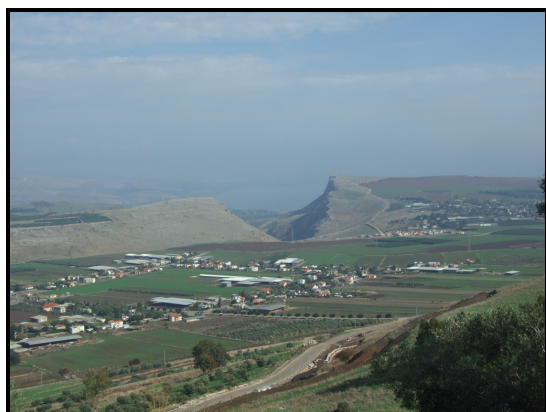
תצפית מקרני חיטין לכיוון מצוק הארבל

בעונה זו של השנה אחד המסלולים היפים לטיול הוא קרני חיטין. המסלול, שצבוע בצבע צהוב במהלך רוב ימות השנה, ובקיץ בפרט, מקבל בתקופה זו גוון ירוק המלווה בשפע פריחה ייחודית של תורמוסים וכלניות. המקום הינו הר געש כבוי שלמרגלותיו נערך אירוע בעל חשיבות היסטורית רבה, קרב קרני חיטין, המגולל את סיפור סיומה של הממלכה הצלבנית הראשונה בארץ. לאחר טיפוס קצר אל פסגת התל נוכל לערוך תצפית מרהיבה לעבר הר תבור, הארבל ושוליה המערביים של הימה הלאומית, הכנרת. את הטיול נסיים במקום הקדוש ביותר לדת הדרוזית, קברו של הנביא שועיב, הלא הוא יתרו, חותן משה.