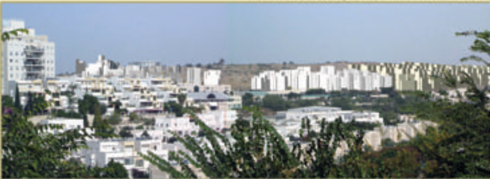
הדמיית גבעת התיתורה לאחר הבניה המתוכננת * אין נגישות לגבעה מכל מקום בעיר

עמדת החברה להגנת הטבע: ישנה חשיבות לבטל את תכנית הבינוי המתוכננת ולשמר את כל שטחה של גבעת התיתורה לטובת התושבים הרבים הפוקדים אותה, להכלת כל המשתמשים בטבע העירוני ולמען שרידותה כשטח טבעי איכותי, שלגדלו חשיבות לתושבים ולמגוון הביולוגי והזואולוגי שבו. בפברואר 2013 התקיים דיון בוועדה המחוזית בנוגע לבנייה בתיתורה, במסגרתו הגישה עיריית מודיעין תוכנית שימור שהוכנה על ידי החברה להגנת הטבע. התוכנית מייעדת את כל שטחה של הגבעה לפארק טבע עם דגש ארכיאולוגי, היסטורי וחינוכי. כמו כן הוצג בוועדה הסדר שהושג בין העירייה למינהל מקרקעי ישראל שלפיו יחידות הדיור שבוטלו בתיתורה יתווספו לשכונות P o L המתוכננות בימים אלו. החלטת הוועדה היתה לשוב ולדון על עתיד התיתורה לאחר שיוצג לוועדה תוכנית P o L, אך עד שלא תבוטל התכנית, איום הבניה על התיתורה עדיין קיים.