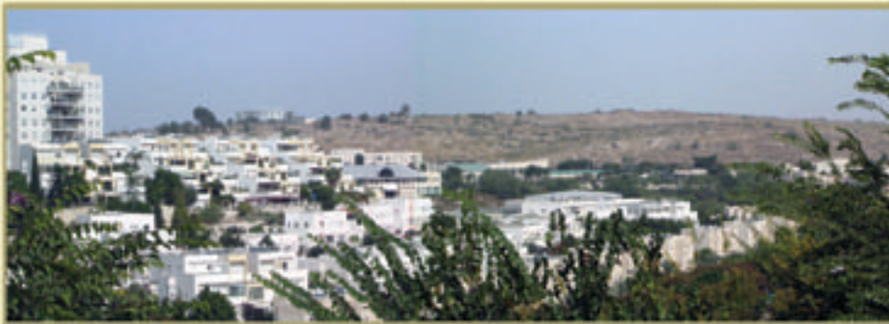
גבעת התיתורה כיום * חלק בלתי נפרד מהעיר