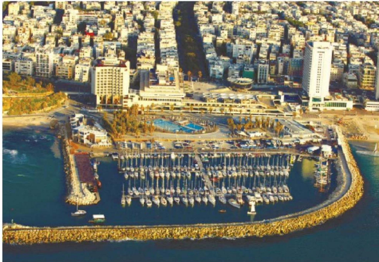
המרינה בתל אביב. בעיר יוקמו מתחמים באזור רידינג, שדה דב והנמל