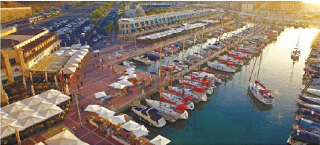
המרינה בהרצליה. "ישראל אינה יעד אטרקטיבי לבעלי יאכטות"

התוכנית נשענת על כך שבישראל יש כבר כיום ביקוש כבד לנקודות עגינה, בהיקף של כ-1,500 כלי שיט – שמביא לכך שבעלי יאכטות נאלצים לעגון בחו"ל